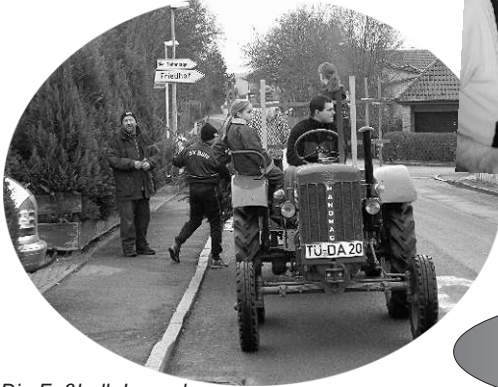
Die Fußball-Jugend beim Einsammeln der ausgedienten Christbäume.