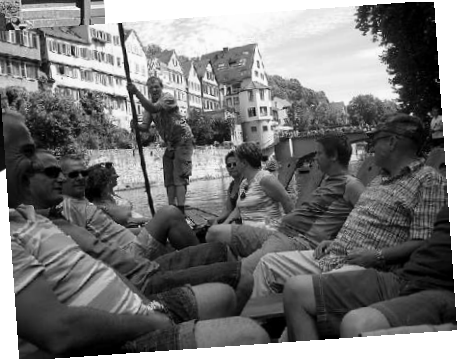
Stocherkahnfahrt mit den elsässischen Gästen aus Buhl.