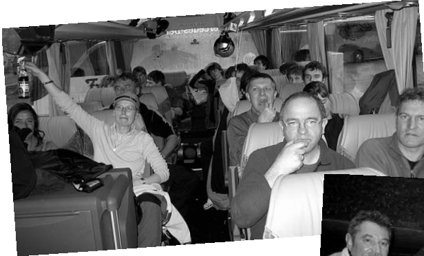
Skiausfahrt der Tennis-Abteilung: ein heftiger Sturm im Montafon hat die Teilnehmer(innen) zum vorzeitigen Apres-Vergnügen verleitet.