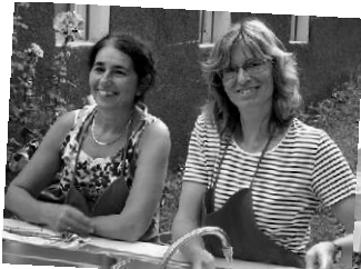
Dorffest 2008: heitere Stimmung trotz Regen. Herzlichen Dank an alle Helferinnen und Helfer!