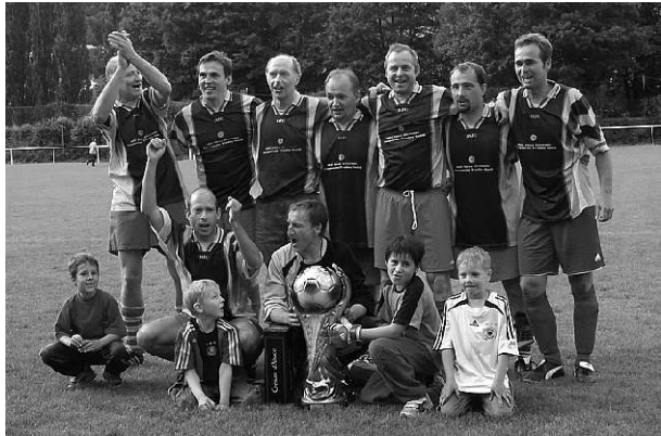
Der Turniersieg beim FC Buhl wurde gebührend gefeiert.