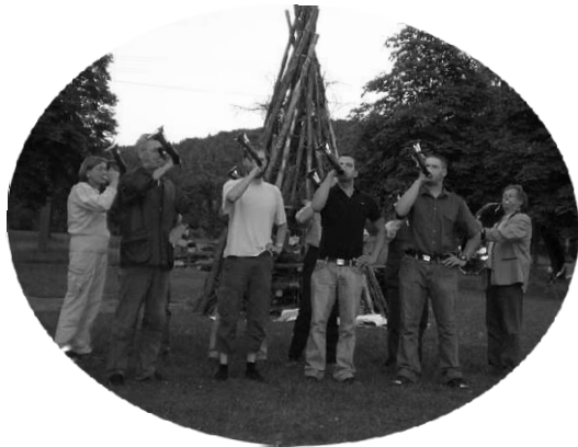
Jagdhornbläser beim Sonnwendfeuer der Tennis-Abteilung