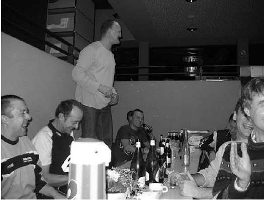
Turnier beim VfB Bühl: Ausgelassene Stimmung vor allem bei den Gästen vom FC Buhl (Elsass).