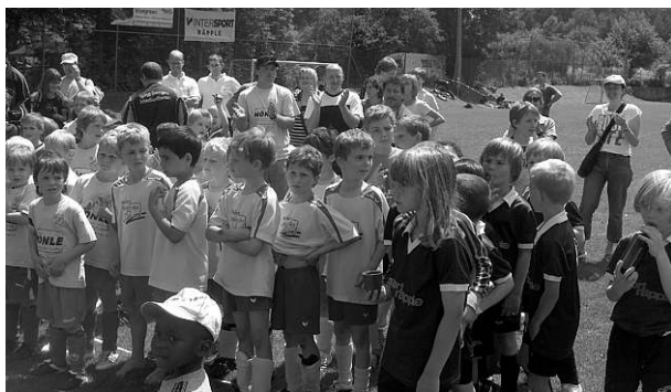
Stolze Sieger beim Dorfturnier