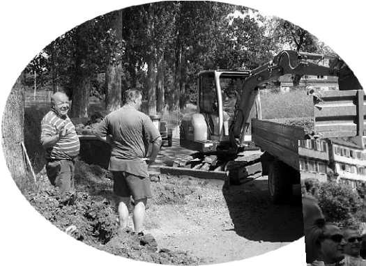
Schwerstarbeit bei der Sanierung des Abwasserkanals beim Sportheim.